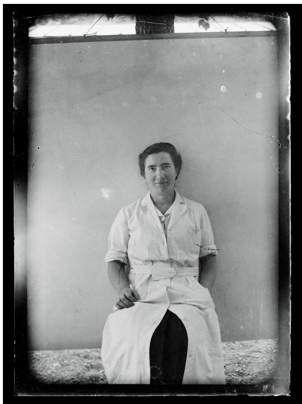
Marguerite Perey en 1938.

Perey realizó su gran aporte a la historia de la ciencia, el descubrimiento del francio, siendo ayudante de laboratorio. Sin duda, una clara muestra da la importancia del personal técnico que trabaja en los laboratorios, cuya labor pasa muchas veces desapercibida. Tras su gran descubrimiento, Marguerite no dejó de trabajar y formarse, ya que no tenía formación universitaria. Finalmente la consiguió y en 1946 defendió su tesis doctoral sobre el actinio K, donde proponía el nombre de francio para el nuevo elemento. Tres años después, la ya doctora Perey obtuvo una cátedra de Química Nuclear en la Universidad de Estrasburgo. Aunque estuvo nominada, no logró obtener el Premio Nobel, si bien consiguió otros galardones como la Medalla Lavoisier de la Sociedad Química Francesa.