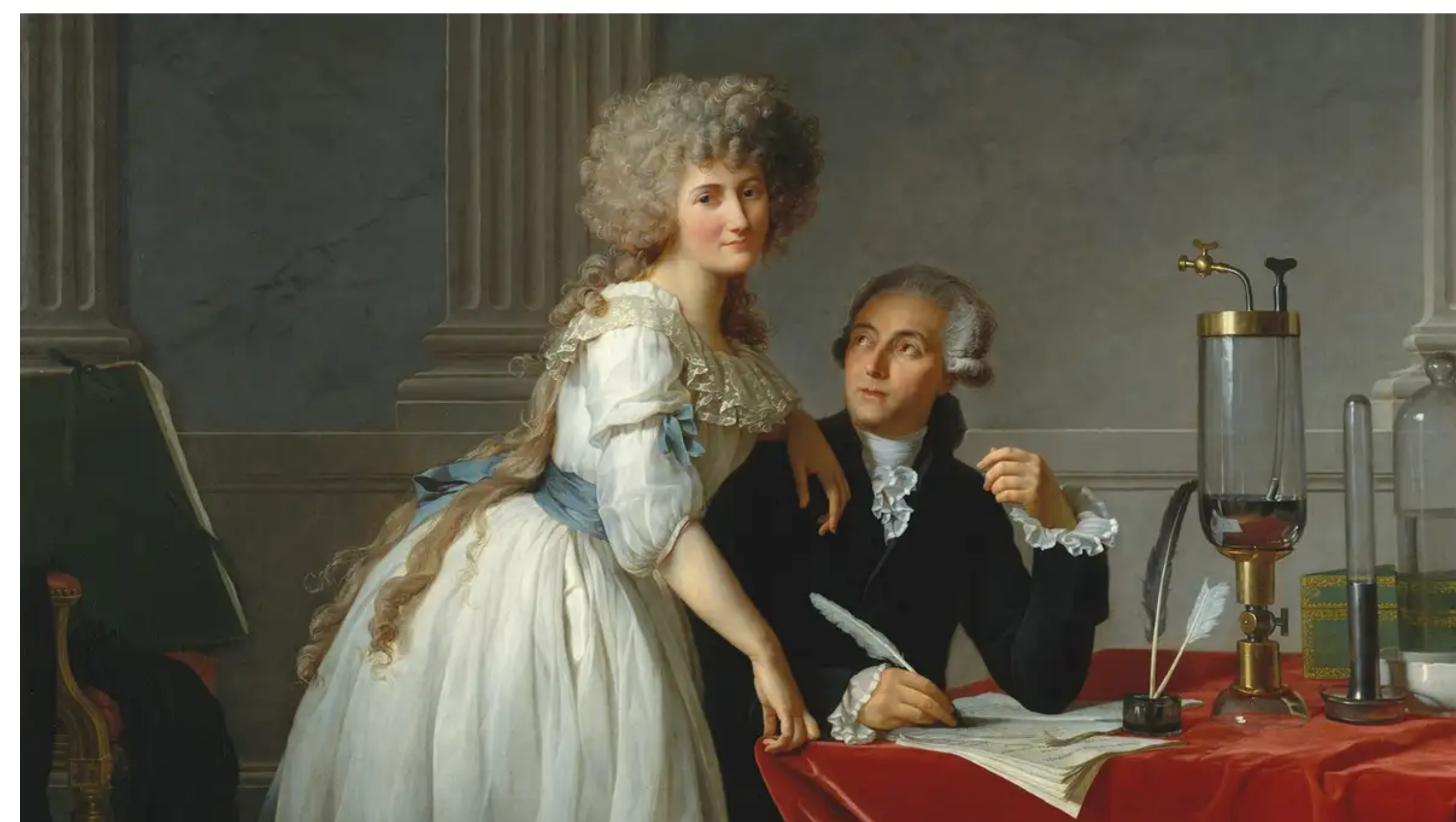
Retrato de Marie Anne Pierrette Paulze y Antoine-Laurent Lavoisier, por Jacques-Louis David (1788). El imponente lienzo neoclásico se puede visitar en el Metropolitan Museum of Art de Nueva York. Adaptada de https://commons.wikimedia.org/wiki/File:David_-_Portrait_of_Monsieur_Lavoisier_and_His_Wife.jpg .

Lavoisier logró una vida acomodada, con tiempo y recursos para dedicarse a la actividad científica y una gran notoriedad social. Su interés por la ciencia le llevó a disponer de un gran laboratorio en El Arsenal, donde cultivó su pasión por la química junto a una fiel colaboradora: su esposa Marie Anne Pierrette Paulze (1758–1836), con quien contrajo matrimonio en 1771.